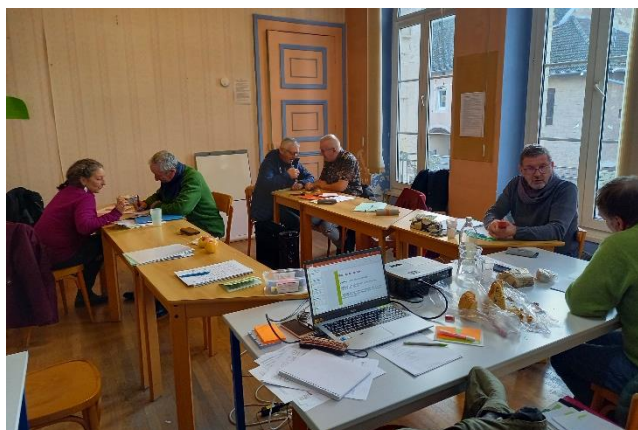
Formation des nouveaux bénévoles

Les bénévoles ont aussi réalisé 6 conseils d'administration élargis à tous les bénévoles en présentiel. Des temps collectifs de suivis de dossier sont aussi organisés lors de chacune de ces rencontres. Ceux-ci permettent le soutien du groupe pour nos bénévoles dans leurs accompagnements.