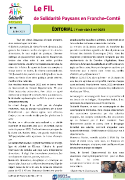
Exemplaire du Fil Juillet 2023

Solidarité Paysans Haute-Saône est co-rédacteur avec SP25 et SP39 du bulletin de liaison et d'information « Le Fil » édité deux fois par an. Ce bulletin est à destination des adhérents, des personnes accompagnées et des partenaires. Il participe également à la mise en lien entre personnes accompagnantes et personnes accompagnées.