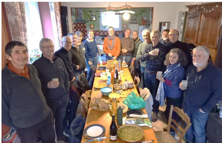
L'équipe des bénévoles SP70