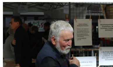
Tenue de stand

Ces moments permettent de communiquer sur notre action, mettre en valeur le bénévolat au sein de l'association et de contribuer à la notoriété de Solidarité Paysans Haute-Saône.