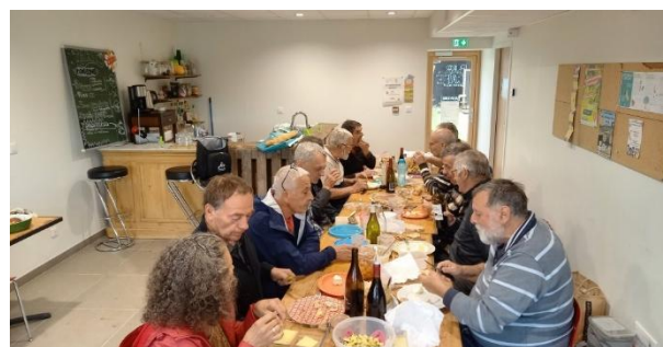
Conseil d'administration élargi du 29/05

Les bénévoles se forment aussi tout au long de l'année, tant la gestion associative que sur la posture d'accompagnant . Ils et elles ont en effet réalisé 7 conseils d'administrations élargis à tous les bénévoles, en présentiel. A la suite de ces temps de vie démocratique, des temps collectifs de suivis des dossiers d'accompagnement sont organisés. Cela permet de soutenir les bénévoles dans leur posture d'accompagnant et d'ouvrir le champ des possibles sur des situations parfois difficiles.