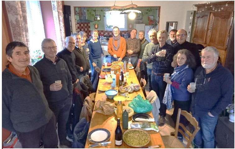
L'équipe des bénévoles SP70 en Janvier 2024