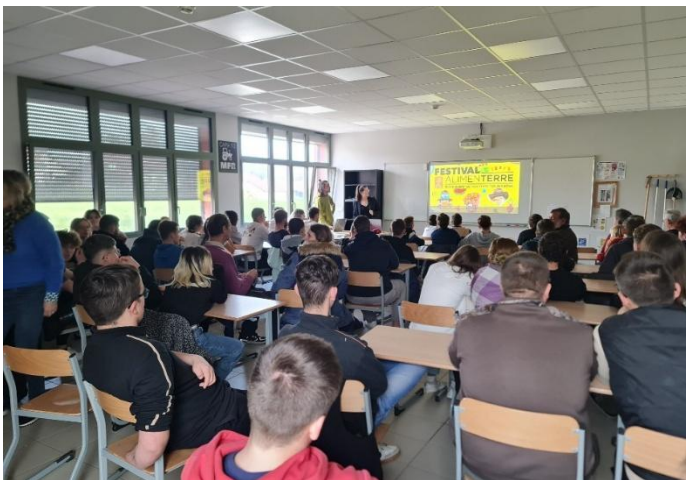
Projection-débat, dans le cadre du festival AlimenTerre à la MFR de Combeaufontaine le

Ainsi les 14 Novembre et 28 Novembre, le collectif InPACT70 a organisé des projection-débat dans le cadre du festival AlimenTerre. Le 14 Novembre, le film Bienvenue Paysanne, d'Olivier Dickinson, a été projeté à la MFR de Combeaufontaine. 46 élèves et 4 monitrices ont été absorbés par les différents parcours des paysans/paysannes. Puis un débat mouvant, avec plusieurs affirmations, a incité les jeunes à se positionner et à s'en expliquer. En sommes, une animation largement empreinte d'Education Populaire, l'un des piliers du collectif InPACT et des associations qui le compose, avec le GIEE Prairies d'Or.