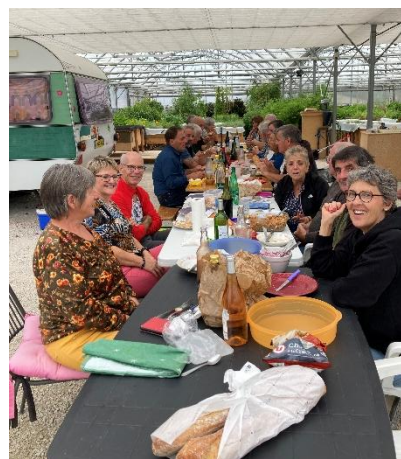
Pique-nique à Avriigny le 22/09

Les bénévoles et quelques agriculteurs accompagnés par l'association se sont retrouvés pour un moment de convivialité le 22 Septembre, sur la ferme d'une de nos accompagnées. L'occasion de découvrir l'aquaponie : cultiver des plantes à parfum, aromatiques et médicinales sur des bassins d'eau dans lesquels vivent des poissons d'eau douce (type carpes).