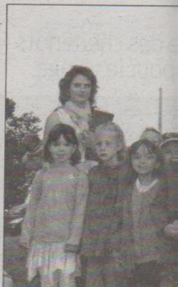
Après avoir travaillé sur L... l'année, les élèves ont dé

Mardi 10 mai, vers 8 h... Moret attendaient le car... avaient rendez-vous avec... Une sortie de fin d'année... maux sauvages après av... maux domestiques tout a... de découvrir un environn... âgés de 2 à 6 ans encadré... sieurs parents d'élèves.