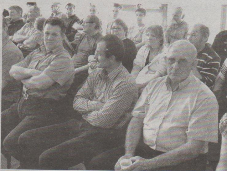
L'association traite plus de la moitié des dossiers en Thiérache.

Ce mardi 10 mai après-midi, une quarantaine de personnes se sont retrouvées à la salle polyvalente pour l'assemblée générale de l'association « Solidarité Paysans Picardie », association créée en 2008. Mettre en confiance un agriculteur confronté à des difficultés sociales juridiques ou économiques sur son exploitation, tel est le but recherché lors de la projection du film : « terres d'entraide ». Film mettant en scène un paysan devenu bénévole de l'association. « Si les gens isolés sont condamnés, quand on est accompagné on est plus fort. Et cette association permet très souvent de retrouver dignité et courage ». Une équipe de quatre salariés et de nombreux bénévoles permet d'offrir aux agriculteurs dont l'exploitation traverse des difficultés, un accompagnement humain, social, technique et juridique. Quant à l'équipe de bénévoles elle est constituée d'agriculteurs en activité ou non qui, pour certains ont rencontré des difficultés sur leur exploitation. Des rencontres qui s'effectuent le plus souvent possible en binôme salariés-bénévoles qui, avant tout, sont complémentaires. Des actions qui visent à répondre aux urgences, à traiter l'endettement, préserver les droits sociaux... A noter que pour la première fois l'assemblée générale s'est tenue à Vervins et Yannick Roussel-Collin, coordinateur Picardie de