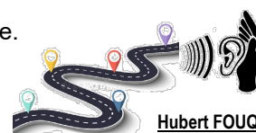
Hubert FOUQUENELLE Bénévole à Arcade

BELLE AVENTURE À TOUS SUR LA ROUTE DE L'ÉCOUTE DE L'AUTRE. »