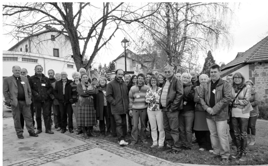
Les bénévoles et salariées de Solidarité Paysans se sont mobilisés pour organiser l'événement

Depuis 2005, les bénévoles et salariées de Solidarité Paysans En Auvergne accompagnent les agriculteurs et leurs familles confrontés à des difficultés. Problèmes économiques, endettement, accidents de la vie, questions juridiques : l'association propose un accompagnement personnel.