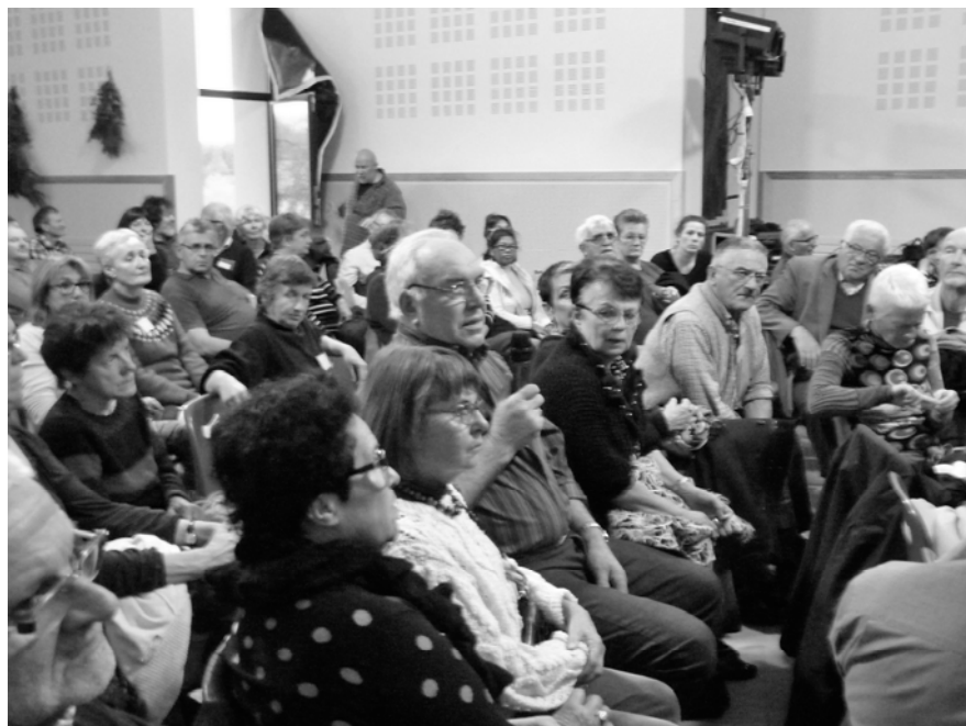
Suite au spectacle, les échanges au siens du public ont été riches et émouvants

Afin de favoriser les échanges entre les spectateurs, un buffet paysan, réalisé par "La Jonquille" a été offert après le spectacle. Nombreux sont les spectateurs qui sont restés pour parler autour d'un verre, poursuivant le débat, échangeant sur leurs expériences personnelles, et sur les émotions suite aux spectacles. « C'était émouvant, proche de notre réalité, cela fait chaud au cœur » témoigne un bénévole. « Je ne connaissais pas ce visage là du monde paysan, je ne pensais pas que c'était si dur pour eux, qu'il y avait tant de pression » ajoute une habitante de LOUBEYRAT.