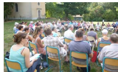
Dernières Rencontres d'été, en 2015 dans l'Ain

au lycée agricole de la Ville Davy à Quessoy (22)